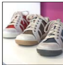
Bequem- und Sportschuhe