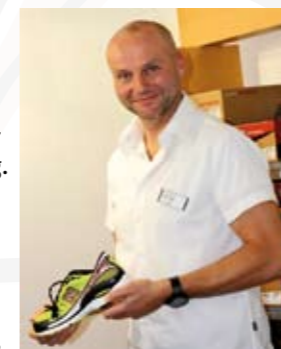
... und wir finden den idealen Laufschuh.

so, dass man sich nebenher noch unterhalten kann. Ein optimaler Pulswert beim leichten Ausdauertraining liegt zwischen 110 und 130 Schlägen pro Minute. Weiter sollte das entsprechende Sportgerät nicht fehlen. Ist das Material nicht gut, macht es auf Dauer keinen Spaß. Walken und Joggen sind verschiedene Sportarten mit unterschiedlichen Belastungen für den Bewegungsapparat. Hochwertige Schuhe müssen nicht teuer sein. Ein gutes Modell findet man für beide Sportarten ab ca. 100 Euro. Somit sollte der Spaß an der Bewegung lange erhalten bleiben und das Ziel, die Vorsätze für das neue Jahr umzusetzen, kann gesund erreicht werden.